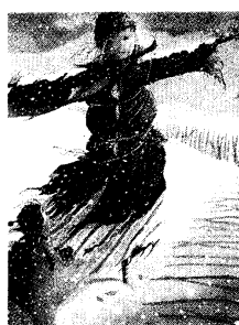
Εικόνα από τις «Μαγευτικές ιστορίες των Χριστουγέννων» (εκδ. Αγκυρα).

Οι Έλληνες συγγραφείς έχουν ωραίες ιδέες για τα Χριστούγεννα. Οχι μόνο τα κείμενα των βιβλίων, αλλά και η εικονογράφηση τους ξεχωρίζει. Κάνω μια να φτάσω στο πιο ψηλό ράφι και κατεβάζω. «Νεράιδα πάνω στο έλατο» του Μάνου Κοιτολέων (εκδ. Πατάκη). Η ιστορία; Λένε πως υπάρχει μια αυλή με ένα έλατο, που κάθε Χριστούγεννα το στολίζουν νεράιδες. Και γι' αυτό οι άνθρωποι αυτής της αυλής περνούν μια χρονιά γεμάτη χαρά, υγεία, ευτυχία και τύχη. «12 Δώρα για τα Χριστούγεννα» από τις εκδόσεις «Παπαδόπουλος», με εικονογραφημένα παραμύθια Ελλήνων συγγραφέων για παιδιά («Ιρίδα» της Αργυρώς Κοκορέλη, «Εξί με Εννέα» του Βασίλη Παπατασορούχα, «Αστέρη μου, φως μου» της Σοφίας Μαντουβάλου κ.ά). Από τις εκδόσεις «Πατάκης» το βιβλίο του Βαγγέλη Ηλιόπουλου «Ο Καλικάντζαρος σώζει το Καλικάντζαροχωριό» (εικονογράφηση Κάρα Μαρέα) με δώρο