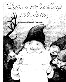
Αγιοβασιλιάτικη ιστορία του Κουεντίν Γκρεμπάν.

Αγαπημένε μου Αγιε Βασίλη... Εχω μπει σε ένα βιβλιοπωλείο για ν' αγοράσω δώρα για τους μικρούς μου φίλους και αισθάνομαι ότι τα χάνω. Ελκνηρα, τάρανδοι, παιδάκια που γελούν, χριστουγεννιάτικα δέντρα, καλικάντζαροι, αστέρια, αγγελάκια και δεν συμμαζεύεται. Φιγούρες εντυπωσιακές, όμορφες, χαριτωμένες που με κοιτούν από τα εξώφυλλα των βιβλίων κι εγώ την ίδια ώρα σκέφτομαι: τι να πρωτοκοιτάω, ποιο ή ποια απ' όλα αυτά τα βιβλία να διαλέξω; Αγαπημένε μου Αγιε Βασίλη, πού είσαι; Εκεί λοιπόν που πάω να εκνευριστώ και να θυμωθώ τις «παλιές καλές εποχές», όπου τα μόνα χριστουγεννιάτικα βιβλία μας ήταν τα κλασικά παραμύθια, λέω όχι. Κάτι γίνεται εδώ, δεν μπορεί. Πράγματι, τα τελευταία χρόνια υπάρχει καταγισμός βιβλίων για παιδιά, ειδικά την περίοδο των γιορτών. Αρκετά από αυτά με αξιοπρεπείς έως άριστες εικονογραφήσεις, κάποια με ενδιαφέρουσες ιστορίες από νέους συγγραφείς. Το κυριότερο είναι ότι μπαίνουν τα σε ένα βιβλιοπωλείο τέτοια εποχή, εκτοξεύονται από πάνω πολλά, με πολλές ιδέες που