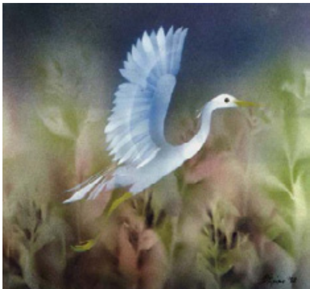
“Το βατραχάκι με την κίτρινη γραμμή” - Ο Ερωδός. Κείμενο: Βάσω Ψαράκη - Εκδόσεις Πατάκη, Αθήνα 1999. Τεχνική Αερογράφος

Η συνάντησή της το 1978 με τον Διονύση και τη Ζωή Βαλάση, οι οποίοι ήδη ασχολούνταν με την εικονογράφηση