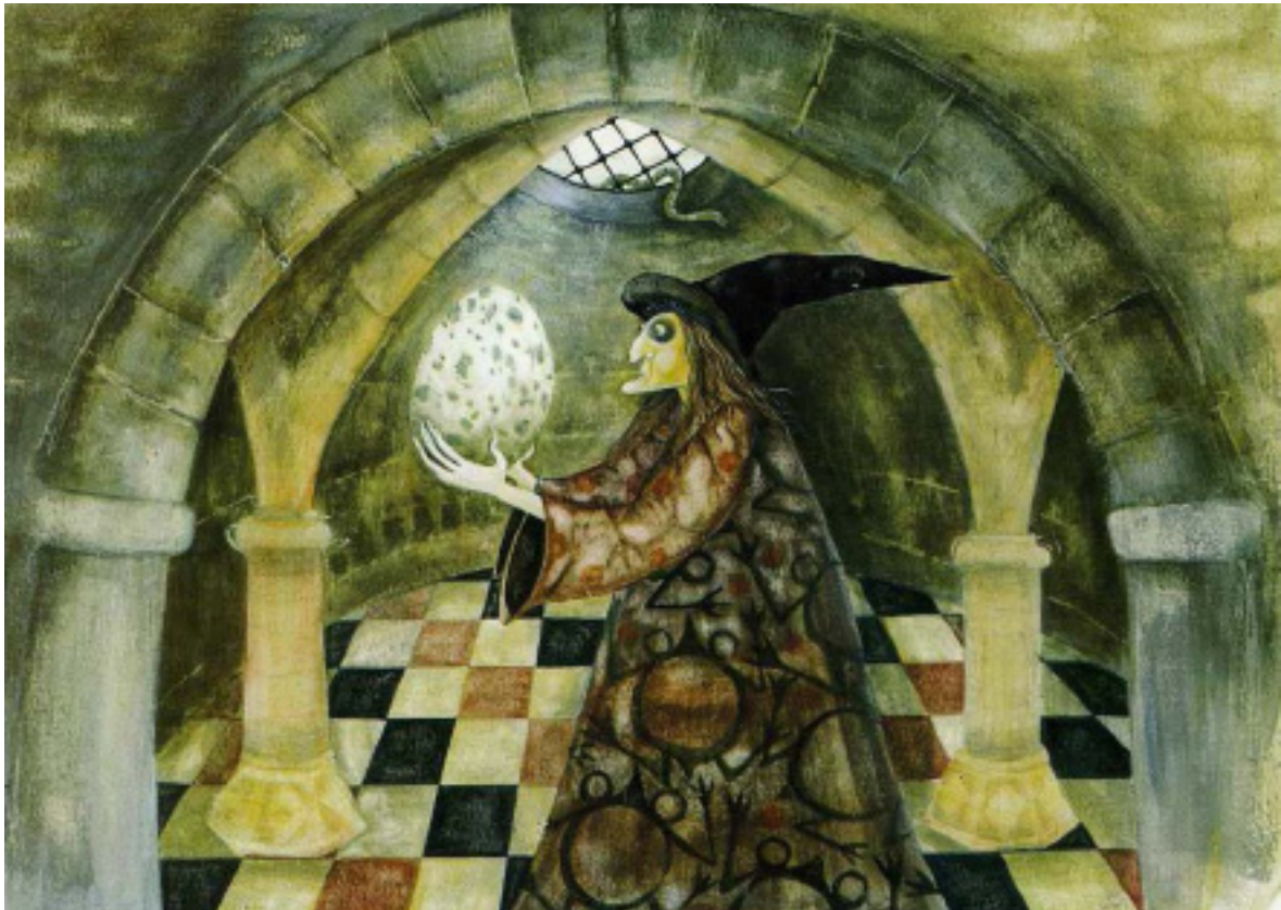
“Η μάγισσα Σουμουτού και οι δράκοντες” - Η Μάγισσα κοιτάζει το αυγό. Κείμενο: Βάσω Ψαράκη - Εκδόσεις Πατάκη, Αθήνα 1998. Τεχνική: Αβγοτέμπερα

Η εικόνα έχει δική της ζωή στο παιδικό βιβλίο; «Βέβαια, έχει δική της ζωή και λειτουργία, παρόλο που η σχέση της εικόνας με το κείμενο στο παιδικό βιβλίο είναι εξαιρετικά στενή. Όμως η επίδρασή της και ο ρόλος της εικόνας εξαρτάται, και κατά κάποιον τρόπο καθορίζεται, και από την ηλικία του αναγνώστη. Για τα μικρά παιδιά το εικονογραφημένο βιβλίο είναι μια μύηση στην ίδια τη ζωή και η εικόνα έχει κυρίως λειτουργία γνωστική. Το παιδί γνωρίζει τον κόσμο μέσα από την εικόνα, η οποία συνοδεύει τη λεκτική περιγραφή του. Ωστόσο η εικόνα δεν περιορίζεται σ' αυτόν το ρόλο, ούτε από το κείμενο, γιατί η ζωγραφική είναι μια τέχνη ανεξάρτητη, με δικές της αξίες, κι αν παίρνει την έμπνευσή της και από το κείμενο δεν μπορεί να μείνει μόνο σ' αυτό. Η εικόνα μπορεί και πρέπει να λέει περισσότερα από όσα λέει ο λόγος, ή να λέει λιγότερα και να ερεθίζει τον αναγνώστη να σκεφτεί κι άλλα. Για τα μεγαλύτερα παιδιά η εικονογράφηση προσφέρει περισσότερα ερεθίσματα στη φαντασία και επηρεάζει τον ψυχικό τους κόσμο.