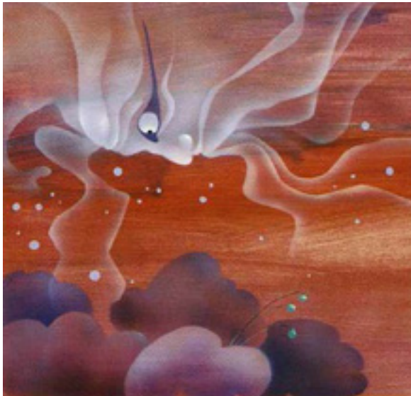
"Τ'αστέρια που ζήλευαν" - Ο Ουρανός Κείμενο: Μελίνα Καρακώστα - Εκδόσεις Πατάκη, Αθήνα 1995 Τεχνική: Ακρυλικά, Τέμπρα, Αερογράφος

Συνηθίζετε να συζητάτε με το συγγραφέα του κειμένου;