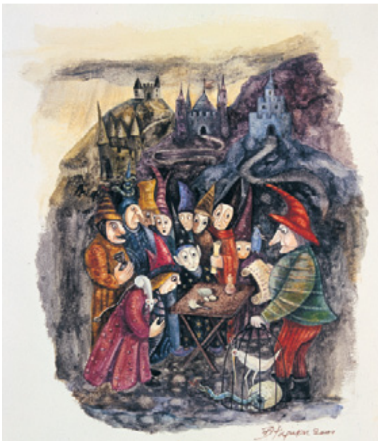
«Ο μάγος Αλμπάντρα και το σοφό βιβλίο της Σουμουτού» Κείμενο: Βάσω Ψαράκη - Εκδόσεις Πατάκη, Αθήνα 2000 Τεχνική: Αβγοτέμπρα

Η τεχνική που κάθε φορά επιλέγει να χρησιμοποιήσει η Βάσω Ψαράκη καθορίζεται από αυτό που της γεννά το κάθε κείμενο. «Με τον αερογράφο θα μπορέσω να αποδώσω καλύτερα μια ονειρική και ήρεμη ατμόσφαιρα», αναφέρει. «Το πενάκι, αντίθετα, μπορεί να δώσει την ένταση και την κίνηση. Η ακουαρέλα έχει μια λεπτότητα και ευαισθησία ενώ η τέμπρα προσφέρεται στην απόδοση της λεπτομέρειας και γι' αυτό μπορεί να δώσει το ρεαλιστικό και το σουρεαλιστικό. Άλλες τεχνικές πάλι βοηθούν στη δημιουργία μιας έντασης, μιας αδρότητας, όπως το κολάζ, ή το παστέλ και το λινόλεουμ». Τα στοιχεία της εικόνας δεν είναι απαραίτητο να συνυπάρχουν πάντα: «Είναι δυνατόν να μην έχουμε χρώματα ή να έχουμε σύνθεση ανεικονική», λέει η εικονογράφος. «Όπως συμβαίνει συχνά να υπάρχουν εικόνες φτιαγμένες με συνδυασμό τεχνικών, με φωτογραφία και τέμπρα, πενάκι και αερογράφο, φωτογραφία και αερογράφο, κολάζ και τέμπρα, λινόλεουμ και τέμπρα...»