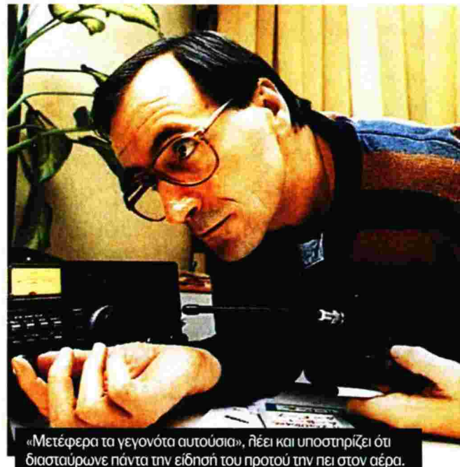
«Μετέφερα τα γεγονότα αυτούσια», λέει και υποστηρίζει ότι διασταύρωνε πάντα την είδησή του προτού την πει στον αέρα.

«Δέχτηκα πολλές απειλές για τη ζωή μου αλλά δεν... μάσησα! Προσπάθησαν πολλοί να με “λαδώσουν” αλλά δεν τα κατάφεραν!»