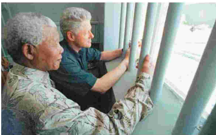
Δύο πρόεδροι, το 1998, κοιτούν πίσω από τα κάγκελα της φυλακής. Ο νοτιοαφρικανός Νέλσον Μαντέλα και ο αμερικανός Μπιλ Κλίντον στο κελί όπου ο πρώτος πέρασε 18 από τα 27 χρόνια του εγκλεισμού του. Είναι το κελί 5 του Τομέα Β στις φυλακές του Ρόμπιν Αϊλαντ, απέναντι από το Κέιπ Τάουν

πίλος δηλώνει κάθε φορά την πηγή (για παράδειγμα: από την ανέκδοτη αυτοβιογραφία που έγραψε στη φυλακή ή συζήτηση με τον Αχμέτ Καθράντα ή από επιστολή προς τη Χίλντα Μπερνστάιν, με ημερομηνία 8 Ιουλίου 1985, σχετικά με τη δίκη της Ριβονίας ή από το κλείσιμο της απολογίας του από το εδώλιο του κατηγορουμένου στη δίκη της Ριβονίας στις 20 Απριλίου 1964). Μέσα από το καλειδοσκόπιο των πολλαπλών πηγών και τεκμηρίων ξεδιπλώνεται η ατομική ιστορία του Μαντέλα και η συλλογική περιπέτεια της Νότιας Αφρικής τον 20ό αιώνα. Ο Μαντέλα σπούδασε Λατινικά στο σχολείο και στο πανεπιστήμιο διάβασε εκτενώς την ελ-