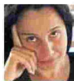
Γράφει η Σοφία Νικολαΐδου

Η αυτοβιογραφία του Μαντέλα, το διάσημο πια Ο μακρύς δρόμος προς την ελευθερία , έγινε μπεστ σέλερ από την έκδοσή του το 1994. Επίσης έργα δημοσιοποιούνται από το γραφείο του από το 1990 που αποφυλακίστηκε. Ο ίδιος έχει δώσει χιλιάδες συνεντεύξεις, ομιλίες, μαγνητοφωνημένα μηνύματα και συνεντεύξεις Τύπου. Ο τόμος Συζητήσεις με τον εαυτό μου αξιοποιεί το αρχείο του Μαντέλα. Επιλέγει πηγές που σχετίζονται κυρίως με την πολιτική στάση του και παρακολουθεί τον λόγο και τη σκέψη του αφρικανού ηγέτη τόσο μέσα στη φυλακή όσο και μετά την αποφυλάκισή του. Συχνά, η έκδοση αντικρίζει το κείμενο με το σκαναρισμένο τεκμήριο (επιστολή, σημείωση). Φωτογραφίες κοσμούν τα διακεκριμένα μέρη του έργου. Το κείμενο δεν παρατίθεται επεξεργασμένο σε μια ενιαία αφήγηση έτσι ώστε να δημιουργείται η εντύπωση μιας συνεχούς ροής, όπου το μόνο που ακούγεται είναι η φωνή του Μαντέλα. Τα τεκμήρια οργανώνονται και παρατίθενται γυμνά. Ο