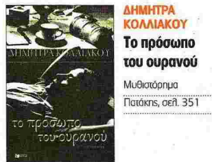
ΔΗΜΗΤΡΑ ΚΟΛΛΙΑΚΟΥ Το πρόσωπο του ουρανού