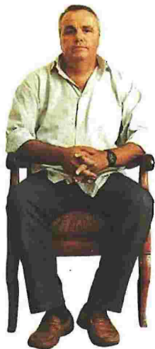
Στα καινούργια διηγήματα του Σωτήρη Δημητρίου πρωταγωνιστούν οι άνθρωποι της μεθορίου