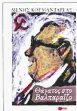
ΜΕΝΗΣ ΚΟΥΜΑΝΤΑΡΕΑΣ «Θάνατος στο Βαλπαράιζο»

Τα ιδεολογικά και ηθικά διλήμματα των δύο πρωταγωνιστών του μυθιστορήματος ο Μένης Κουμανταρέας τα διαχειρίζεται σε αυτή του την κατάθεση με αξιοσημείωτο νεωτερικό τρόπο. Φλας μπακ, φαντασιακές σκηνές, πρωτοπρόσωπες αφηγήσεις εγκιβωτισμένες στην κύρια αφήγηση κ.ά. υπηρετούν την «αλήθεια» του καθενός χωρίς να υπονομεύουν παράλληλα και την απαιτητική πλοκή. Ωστόσο θα έλεγα ότι ο λογοτεχνικός τους διάλογος, επί της ουσίας, μας υπενθυμίζει έναν κλασικό αφορισμό του Κ. Πόπερ, που πρέπει να έχουμε υπόψη μας: «Όταν και οι δύο συνομιλητές έχουν άδικο, αυτό δεν σημαίνει ότι και οι δύο έχουν δίκιο».