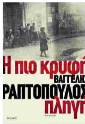
Τα πλοκάμια του Εμφυλίου και ο φόβος για έναν νέο.