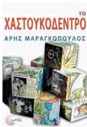
Οι δεκαετίες του '50 και του '60 στο βιβλίο του Α. Μαραγκόπουλου.

Ο νεότερος της παρέας, ο Πέτρος Κουτσιαμπασάκος, με το δεύτερο μόλις βιβλίο του και πρώτο του μυ-