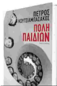
ΠΕΤΡΟΣ ΚΟΥΤΣΙΑΜΠΑΣΑΚΟΣ Πόλη Παιδιών Σελίδες: 419 Εκδόσεις Πατάκη Τιμή: €17,50