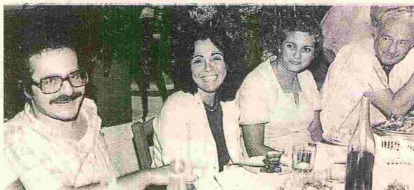
Ο Μίμης Ανδρουλάκης με τη Μαρία Διαμανάκη και τον τότε (δεκαετία '70) γενικό γραμματέα του ΚΚΕ, Χαρίλαο Φλωράκη.

ΣΤΟ «Οπλων κρίσις» ο Μίμης Ανδρουλάκης αποκαλύπτει άγνωστους διαλόγους του Ανδρέα Παπανδρέου με τον Χαρίλαο Φλωράκη. Το ίδιο κάνει και με μια συνάντηση του ιστορικού γηγέτη του ΚΚΕ με τον Γραμματέα του Ιταλικού ΚΚ Ενρίκο Μπερλινγκουέρ. Ο συγγραφέας βάζει τον Ανδρέα Παπανδρέου να σχολιάζει τις επίμονες προσπάθειες του ΚΚΕ για συνεργασία με το ΠΑΣΟΚ. Αναφέρει: «Ο Χαρίλαος μου έλεγε: "Βρε Αντρέα, μπας και πάσχεις από σύνδρομο εκπαρθύρωσης απέναντι στην κομμουνιστική Αριστερά; Φοβάσαι ότι, αν ανέβουμε κι εμείς στο τρένο της Αλλαγής θα σε εκπαρθύρωσουμε σε μια επόμενη στάση; Εμείς δεν είμαστε οπαδοί της διαρκούς επανάστασης του Τρότσκι!". Πολιτικές ανασφάλειες είχα, καμιά φορά αδικαιολόγητες, υπερβολικές, ίσως και ανρθολογικές, αλλά δεν ένιωθα ποτέ "Κερένσκι!" απέναντι στο ΚΚΕ, τουλάχιστον στη Μεταπολίτευση. Αυτοί μάλλον είχαν