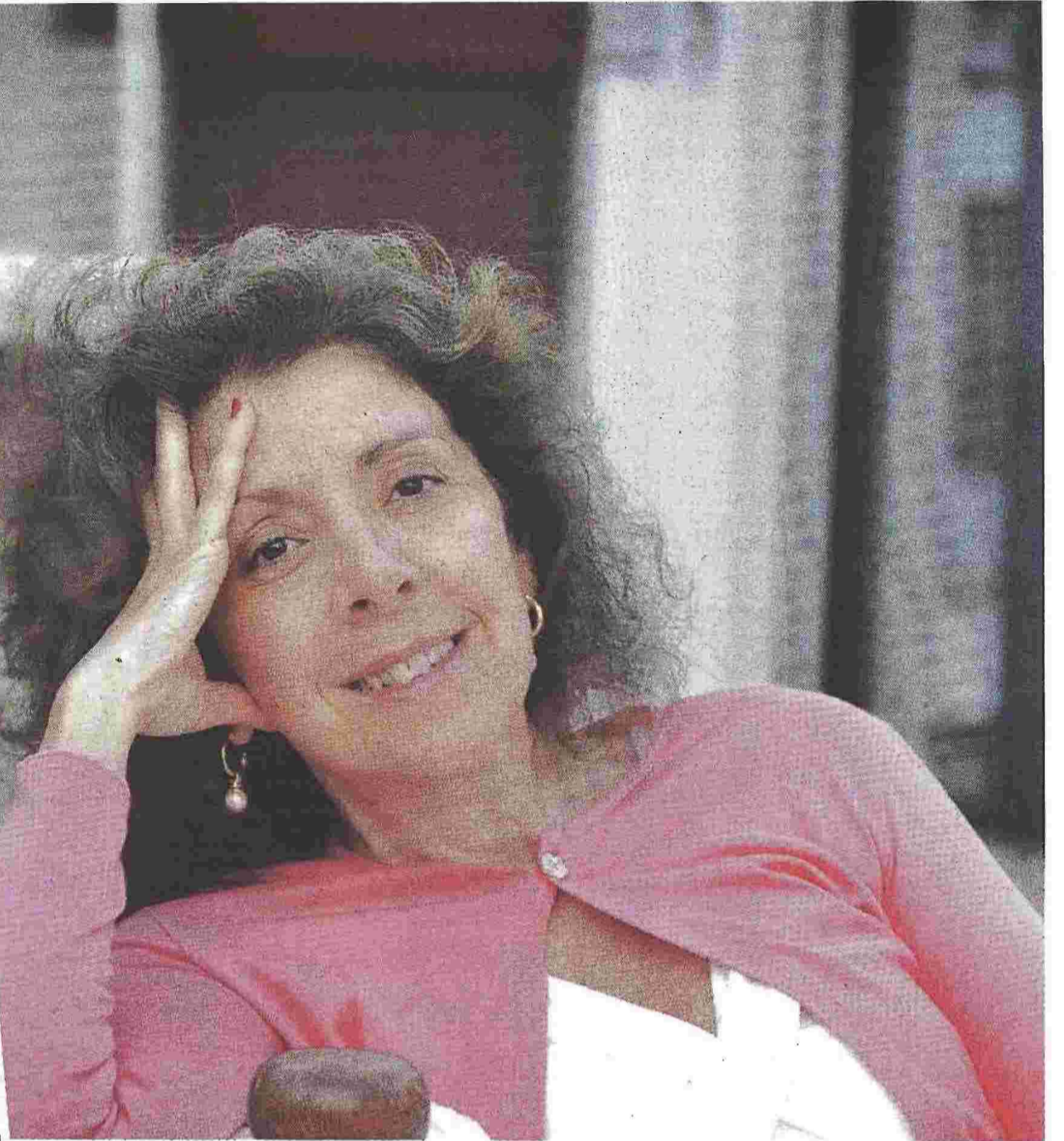
Το λογοτεχνικό βιβλίο της Ιφιγένειας Θεοδώρου «Η γεύση της ερήμου» κυκλοφορεί από τις εκδόσεις Πατάκη