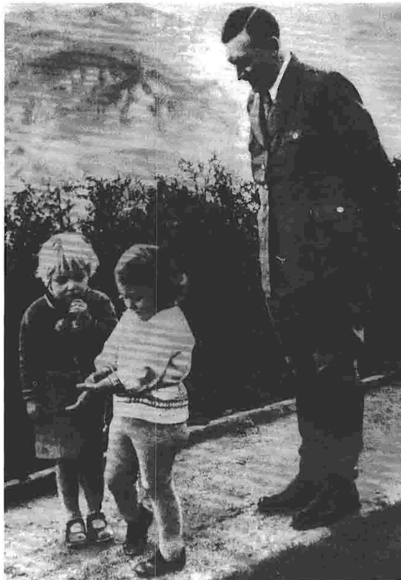
Ο Αδόλφος Χίτλερ με παιδιά σε κατασκήνωση του ναζιστικού κόμματος.

Αξίζει να σημειώσουμε ότι, ως κύρια πηγή έμπνευσης του έργου του ο Χίτλερ αναφέρει τον αμερικανό επιχειρηματία Χένρυ Φορντ και το βιβλίο του Ο Διεθνής Εβραϊός , ενώ το πορτρέτο του Φορντ κοσμούσε