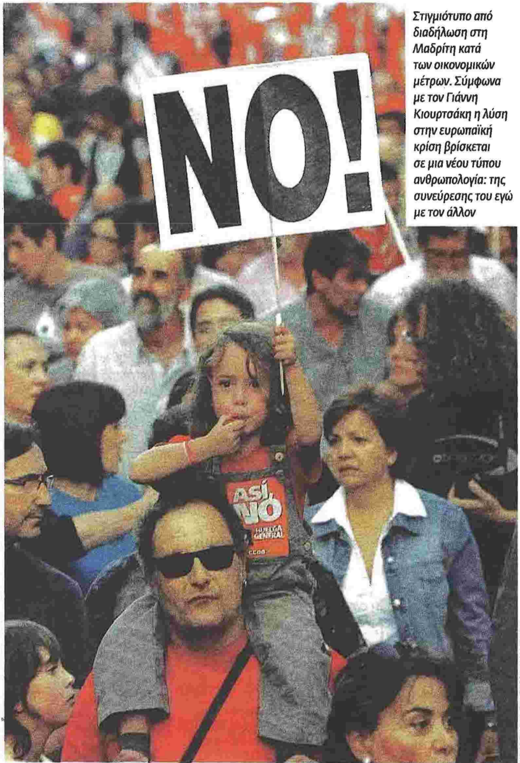
Στιγμιότυπο από διαδήλωση στη Μαδρίτη κατά των οικονομικών μέτρων. Σύμφωνα με τον Γιάννη Κιουρτσάκη η λύση στην ευρωπαϊκή κρίση βρίσκεται σε μια νέου τύπου ανθρωπολογία: της συνεύρεσης του εγώ με τον άλλον

Πολλά είναι εκείνα που με χωρίζουν προσωπικά από την προσέγγιση του Κιουρτσάκη: η ροπή του, για παράδειγμα, προς έναν έστω μετριοπαθή κοινοτισμό που δεν αποφεύγει στο τέλος ένα ειδυλλιακό στοιχείο ή η βαριά καχυποψία του έναντι της ψηφιακής τεχνολογίας, που παραγνώνει τη συμβολή της στην εξάπλωση της γνώσης και στον εκδημοκρατισμό της επικοινωνίας.