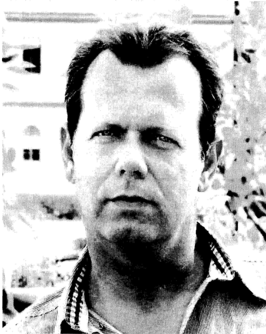
Το δράμα που βίωσαν οι Ελληνίδες μάνες στη διάρκεια του Εμφυλίου αποτυπώνεται στην τετραλογία του Θοδωρή Παπαθεωδώρου

ΘΟΔΩΡΗΣ ΠΑΠΑΘΕΩΔΩΡΟΥ ΟΙ ΚΑΙΡΟΙ ΤΗΣ ΜΝΗΜΗΣ ΕΚΔΟΣΕΙΣ ΨΥΧΟΓΙΟΣ, 2011. ΣΕΛ. 640, ΤΙΜΗ 18,80 ΕΥΡΩ