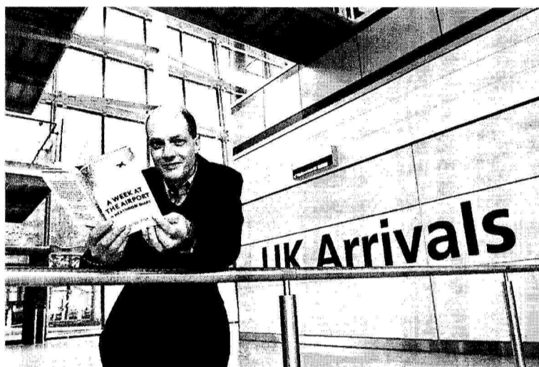
Ο Αλαίν ντε Μποττόν επιχειρήσε να μεταφέρει στους αναγνώστες κάτι από τη χαστική ζωή του αεροδρομίου

Ο Ντάγκλας Ανταμ στο «Αντίο και ευχαριστώ για τα ψάρια» είχε διαπιστώσει: «Ποτέ δεν έχει γραφτεί η φράση είναι ωραίο σαν αεροδρόμιο». Ο Αλαίν ντε Μποττόν, ωστόσο, διαφωνεί. Ο χώρος των αεροδρομίων δεν είναι μόνον αποκαλυπτικός της ανθρώπινης κατάστασης στον πολιτισμό μας αλλά και εξαιρετικά γοητευτικός. Η γοητεία του, μάλιστα, πουθενά δεν αποτυπώνεται εντονότερα απ' ό,τι στις οθόνες που είναι τοποθετημένες στους σταθμούς και ανακοινώνουν με τις άρπες γραμματσοειρές τους τα δρομολόγια που πρόκειται να πραγματοποιηθούν στους αιθères. Στις οθόνες αυτές, ο Ελβετός συγγραφέας βλέπει τις άπειρες πιθανότητες που δυνητικά ο καθένας από μας έχει για εναλλακτικές ζωές, οι οποίες αναδύουν από μέσα μας θολές εικόνες νοσταλγίας και προσμονής. Την κατάσταση αυτήν αλλά και πολλές ακόμη είχε την ευκαιρία να διαπιστώσει ο Αλαίν ντε Μποττόν, όταν το καλοκαίρι του 2009, καλεσμένος από τους ιδιοκτήτες του Χίθροου, πέρασε μια ολόκληρη εβδομάδα στο αεροδρόμιο. Η παραμονή του εκεί, με το γραφείο του τοποθετημένο σε θέση περίοπτη, υπήρξε μια ανοικτή πρόκληση για τους χρήστες του αεροδρομίου, ως ένα είδος εγγύησης πως η ζωή, έστω και για μια εβδομάδα, θα