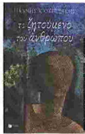
ΓΙΑΝΝΗΣ ΚΙΟΥΡΤΣΑΚΗΣ «Το ζητούμενο του ανθρώπου» (εκδ. Πατάκη)

που» (εκδ. Πατάκη). Η κρίση δεν είναι μόνο ελληνική ούτε αποκλειστικά οικονομική, υποστηρίζει ο Κιουρτσάκης. Είναι ριζικά ανθρωπολογική και πλήττει ολόκληρο τον πλανήτη. Το μοντέλο της στρεβλής «ανάπτυξης» εδώ, μολοντί «υιοθετήθηκε αβασάνιστα» από τον ελληνικό πληθυσμό, δεν παύει να είναι ένα μοντέλο επιβεβλημένο άνωθεν, στο πλαίσιο ενός όλο και πιο παγκοσμιοποιημένου καπιταλισμού, όπως γράφει. Μήπως χρειάζεται να ξανασκεφτούμε τα πράγματα από την αρχή; Μήπως πρέπει να ξανακερδίσουμε το χαμένο νόημα της λέξης «οικονομία» κι αντί να προσκυνού-