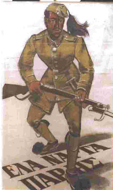
ΠΑΝΩ ΑΡΙΣΤΕΡΑ: «Με το χαμόγελο στα χείλη»: Έλληνες στρατιώτες αναχωρούν για το μέτωπο. ΠΑΝΩ ΔΕΞΙΑ: Ο Ιωάννης Μεταξάς ΑΡΙΣΤΕΡΑ: Αφίσα της εποχής