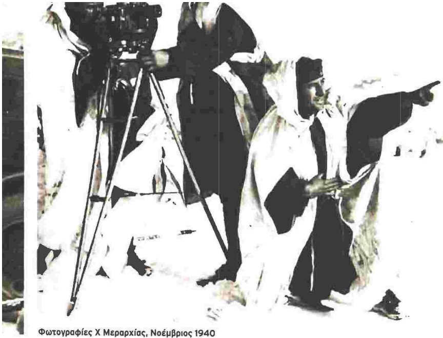
Φωτογραφίες Χ Μεραρχίας, Νοέμβριος 1940

σαν να εμφανίζονται οι πρώτες δυσκολίες. Η μεγάλη επιδείνωση του καιρού, η εξάντληση των στρατιωτών και οι δυσκολίες ανεφοδιασμού, κυρίως σε ιματισμό και αρβύλες, καθήλωσαν τον ελληνικό στρατό και καθιστούσαν αδύνατες τις επιθετικές επιχειρήσεις. «Δυσχέρεια εφοδιασμού. Απώλεια κτηνών - κρυοπαγήματα - έλλειψη καμión (...) Τι θα υποφέρουν οι στρατιώτες μου» σημειώνει ο Μεταξάς στις 26 Δεκεμβρίου. Λίγες ημέρες αργότερα απορρίπτει τη βρετανική πρόταση για εγκατάσταση βρετανικής αεροπορίας στη Θεσσαλονίκη για να μην προκαλέσει γερμανική επίθεση δηλώνοντας ότι «εάν οι Άγγλοι έχουν αεροπορικές δυνάμεις να αποκρούσουν και να επιτεθούν κατά της Γερμανίας, συμφέρει. Εάν δεν έχουν, δεν συμφέρει». Παράλληλα, δεν