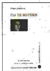
Γιώργος Σισλιάνου ΓΙΑ ΤΗ ΜΟΥΣΙΚΗ Εμπέδεια: Ελλην Γιωτοπούλου - Σισλιάνου Εκδ. Μουσείο Μπενάκη / Κέντρο για την Ελληνική Μουσική

Η σύζυγος του μεγάλου συνθέτη, Ελλην Γιωτοπούλου - Σισλιάνου, συγκεντρώνει εισηγήσεις, συνεντεύξεις και δημοσιεύσεις του σχετικά με τη μουσική παιδεία και τη μουσική πολιτική στην Ελλάδα, κείμενα θεωρητικών προβληματισμών, διαλέξεις πάνω στη σύγχρονη μουσική σκηνή, καθώς και σύντομες αναλύσεις των έργων του από τον ίδιο, δίνοντας μια ολοκληρωμένη άποψη για την προσωπικότητά του. Σκοπός της είναι να γίνει ευρύτερα γνωστή η δράση του Σισλιάνου, «ως συνειδητού και ενεργού μέλους μιας κοινωνίας με καιρία πολιτισμικά κενά, που υπήρχαν όταν έγραφε και που δυστυχώς στην πλειονότητά τους εξακολουθούν να υπάρχουν».