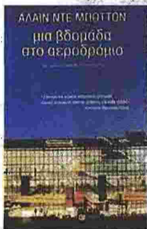
Αλέν ντε Μποτόν ΜΙΑ ΒΑΘΜΑΔΑ ΣΤΟ ΑΕΡΟΔΡΟΜΙΟ Μτφ. Αντώνης Καλοκύρης Εκδ. Πατάκι

μήματα της Βρετανίας. Έχει ύψος 40 μέτρα, πλάτος 176 και μήκος 396, η-πανύψηλη κρύσταλλινη σφραγή του, φτιαγμένη από αδιαφανή κρύσταλλα, στηρίζεται σε μια σειρά από 22 σταλινά δέντρα που εκτείνονται σε όλο το μήκος του σταθμού, διαθέτει ένα τεράστιο εμπορικό κέντρο με 155 καταστήματα και εστιατόρια και έχει τη δυνατότητα να εξυπηρετεί 35 εκατομμύρια επιβάτες τον χρόνο.