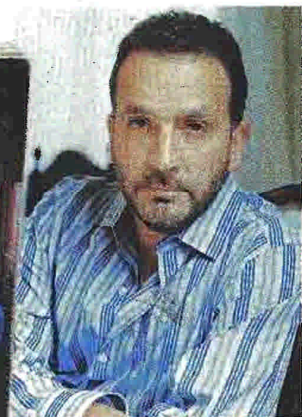
Ο Ελληνοαμερικανός Τζορτζ Πελεκάνος κατακτά ολοένα και καλύτερες θέσεις στις λίστες των μπεστ σέλερ