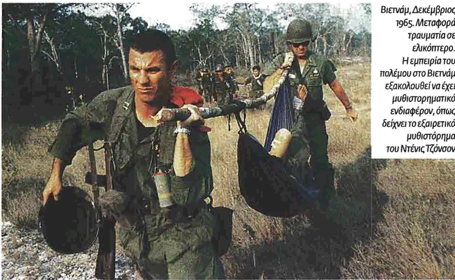
Βιετνάμ, Δεκέμβριος 1965. Μεταφορά τραυματία σε ελικόπτερο. Η εμπειρία του πολέμου στο Βιετνάμ εξακολουθεί να έχει μυθιστορηματικό ενδιαφέρον, όπως δείχνει το εξαιρετικό μυθιστόρημα του Ντένις Τζόνσον

ριωδία όμως και η αποκίνωση θα τον οδηγήσουν σε μια κατάσταση πνευματικής και ψυχικής διάλυσης καθώς βλέπει μέσα από τις καλές προθέσεις να αναδύεται το κακό και τελικά να επικρατεί. Μεταξύ άλλων παρακολουθούμε τους αδελφούς Χιούστον, τον Μπίλ και τον Τζέιμς, που άφησαν την έρημο της Αριζόνας για να βρεθούν σε έναν πόλεμο όπου η διάφευση γίνεται τρομακτική, οι παραισθήσεις καταπίνουν την πραγματικότητα και η παραπληροφόρηση οδηγεί στην παραφροσύνη. Ο Ντένις Τζόνσον καταπίνεται, στα χνάρια του Νόρμαν Μέιλερ, με πολλά είδη γραφής. Εγινε γνωστός με το βιβλίο του Jesu's Son (1992), μια συλλογή αυτοβιογραφικών διηγημάτων, βουτηγμένα στην ψυχική οδύνη, στα ναρκωτικά και στην αλητεία. Η Αμερική του Τζόνσον είναι πάντα μια χώρα στα πρόθυρα της Αποκάλυψης.