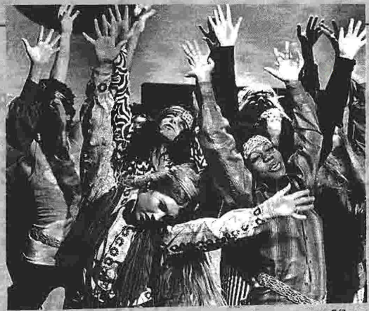
Η δεκαετία του '60 και της ψυχεδέλειας είναι αγαπημένο θέμα του Τόμας Πίντσον

(Εκδόσεις Κέδρος, μετάφραση Αγορίτσα Μπακοδήμου, σελ. 549, τιμή 25 ευρώ) βγήκε το 1952, σε μια ταραγμένη περίοδο, όπου ο ρατσισμός στις ΗΠΑ ήταν ακόμη στην ημερησία διάταξη. Η ιστορία ενός ανώνυμου αφροαμερικανού ήρωα, «αόρατου από το σύστημα». Συνοπτικά, το εμβληματικό αντιρατσιστικό μυθιστόρημα και ένα από τα καλύτερα βιβλία του 20ού αιώνα.