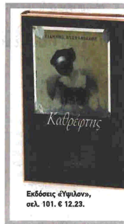
Εκδόσεις «Ύψιλον», σελ. 101. € 12.23.

Εξάλλου, ο συγγραφέας του ακολουθώντας φίνες εμμονές των προκατόχων του, στη συνέχεια συνομιλεί και μέσω κινηματογραφικού «Καθρέφτη» με τον Ταρκόφ-