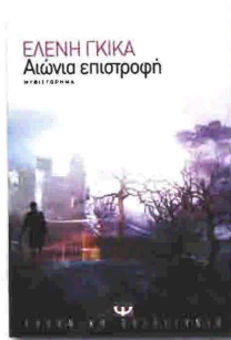
Ελένη Γκίκα Αιώνια επιστροφή

Σελίδες: 368, τιμή: 16,88 €, εκδόσεις Καστανιώτη.