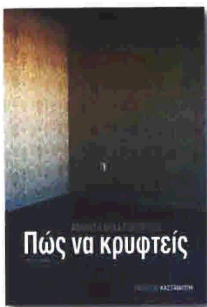
Αμάντια Μιχαλοπούλου Πώς να κρυφτείς

ΕΠΙΜΕΛΕΙΑ: ΔΕΣΠΟΙΝΑ ΣΑΒΒΟΠΟΥΛΟΥ dsav@otenet.gr