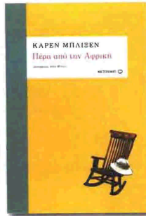
Κάρεν Μπλιξεν Πέρα από την Αφρική

Σελίδες: 456, τιμή: 17,70 €, εκδόσεις Ψυχογιός.