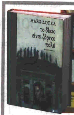
Εκδ. «Πατάκι», σελ. 576, € 21.50.

Και χωρίς να γκρεμίζει εκεί όπου δεν έχει ακόμα χτίσει ψυχανεμίζεται: «Ορθία στο παράθυρο, μου φαινόταν ότι καθρεπίζονταν ακνά στα τζάμια τα πόστερ που δεν μου έλεγαν τίποτα πα. Κι όμως μου ήταν δύσκολο να τ' αποχωριστώ, εφόσον, μας και δεν είχα άλλα να κολλήσω, θα μ' ενοχλούσαν τα σημάδια τους στον τοίχο. Κι ήταν νορίς για μένα τότε να γνωρίζω ότι