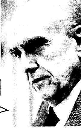
Στη προσπάθειά του να ερμηνεύσει τη στάση των αξιωματικών της αμερικανικής αποστολής στη χώρα μας τον Απρίλιο του 1967, με κορύφωση το πραξικόπημα των συνταγματάρχων και την έναρξη της επτάχρονης τυραννίας (1967-1974).

• Αβυσσαλέος ο ανταρδισμός στην Ουάσινγκτον • Τον θεωρούν... ηπιότακτο • Παράρτημα της CIA η ΚΥΠ...