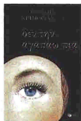
Θανάσης Χειμωνάς ΔΕΝ ΤΗΝ ΑΓΑΠΑΩ ΠΙΑ ΕΚΔ. ΠΑΤΑΚΗ 2010, ΣΕΛ. 114

Ο συνδυασμός μιας καθημερινής, φαινομενικά ασήμαντης ιστορίας που κορυφώνεται και τελειώνει με δραματικό τρόπο, φαίνεται να οφείλεται στην πρόθεση του Θανάση Χειμωνά να γράψει ένα αφήγημα-καθρέφτη του θολού ψυχισμού των σημερινών νέων, εγκλωβισμένων μέσα στη σύγχρονη ελληνική κοινωνική πραγματικότητα που νοθεύει τα αισθήματα και μηδενίζει τα ηθικά κίνητρα των πράξεων. Πρόκειται, λοιπόν, για ένα αφήγημα με θέμα την ανερμάτιστη γενιά του Χειμωνά. Ο σκοτεινός κι αδιέξοδος έρωτας, η συντριπτική αίσθηση της μοναξιάς, το διαλυτικό αίσθημα του κενού, είναι βασικά γνωρίσματα και των πέντε παλαιότερων βιβλίων του, από το Ραμόν (1998) μέχρι τη Ραμόλα επιδεινωσι (2008).