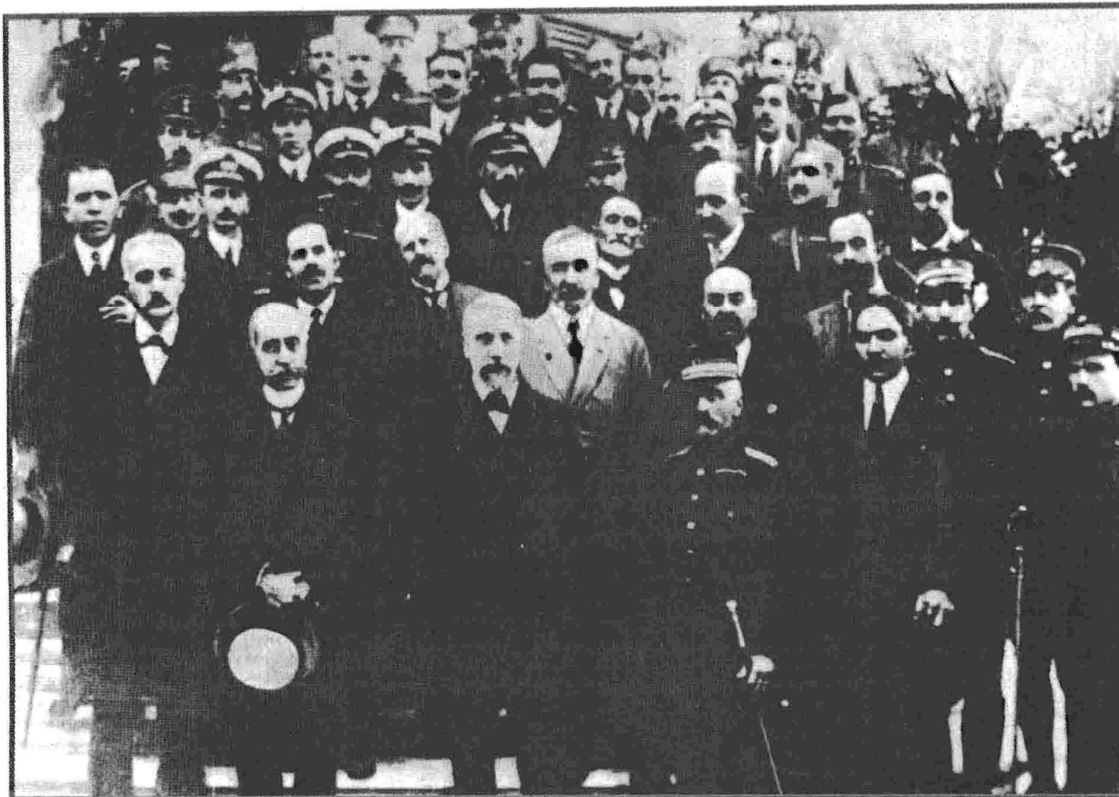
Στις 26 Σεπτεμβρίου 1916 ο Ελ. Βενιζέλος σχηματίζει προσωρινή κυβέρνηση στη Θεσσαλονίκη

πριν από τα γεγονότα του Δεκεμβρίου, δεν είχαν αποδώσει τα αναμενόμενα. Παρά τις καταγγελίες περί αντισυνταγματικών ενεργειών των Ανατόρων, εκείνο που κινούνταν εκτός συνταγματικού πλαισίου ήταν το ίδιο το βενιζελικό κίνημα. Το στοιχείο δε, το οποίο είχε φέρει τους κύκλους της Θεσσαλονίκης στο χείλος της απόγωσης, ήταν ο δισταγμός και ο προβληματισμός των χωρών της Συνενοήσεως. Η ύπαρξη του κινήματος ήταν συμφασμένη με την αμέριστη συμπαράσταση των τελευταίων, κάτι που, δυστυχώς, δεν συνέβαινε. Υπό αυτές τις συνθήκες, μοναδική ελπίδα αποτελούσε μια αμετάκλητη ρήξη των ελληνοσυνμμαχικών σχέσεων. Έτσι εξηγούνται και οι προνομιακές σχέσεις, που οι κύκλοι της Θεσσαλονίκης καλλιέργησαν συστηματικά με την πλέον ακραία και προκλητική πτέρυγα της Συμμαχικής παράταξης, εκείνη των μυστικών υπηρεσιών.