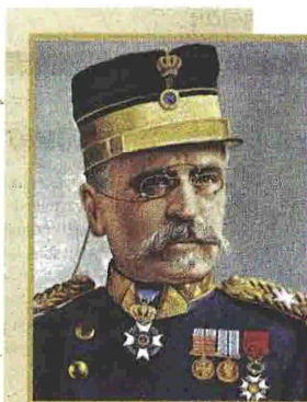
Ο στρατηγός Π. Δαγκλίς επέβλεπε την οργάνωση του στρατού της Εθνικής Άμυνας

Η κρίση εκδηλώθηκε ταυτόχρονα σε δύο επίπεδα: εσωτερικό και διεθνές. Άλλωστε, σε αυτήν ακριβώς τη συγκυριακή επικάλυψη ανάμεσα σε ετερογενή φαινόμενα (ελληνικές πολιτικές και κοινωνικές αντιπαράθεσεις - διεξαγωγή του Α' Παγκοσμίου Πολέμου) οφείλονται οι εκρηκτικές και ανεξέλεγκτες διαστάσεις, τις οποίες προσέλαβε γενικότερα το Ελληνικό Ζήτημα των ετών 1914 - 1918. Η αντιπαράθεση μεταξύ δύο διαφορετικών κοινωνικών τάξεων, με αντικείμενο τον έλεγχο και την άσκηση της εξουσίας, πήρε, προς στιγμήν, την σπατηλή μορφή μιας διαφοράς γύρω από τη στάση της χώρας έναντι του πολέμου. Το διυπόστατο της όλης υπόθεσης κυριάρχησε και στη συγκεκριμένη περίπτωση των γεγονότων του Δεκεμβρίου. Επομένως, είναι δύσκολο να επικριθεί κανείς να διαχωρίσει τα συστατικά στοιχεία ενός συμπαγούς συνόλου και να τα εξετάσει ατοδύναμα. Ίσως να ήταν και ανώφελο, καθώς ελ-