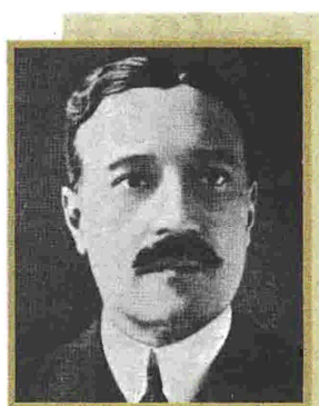
Η διαμεσολάβηση του Γάλλου απεσταλμένου Βουλευτή Μπεναζέ δεν απεσώβησε τα Νοεμβριανά

Η στιγμή αιχμή σύγκλισης όλων των παραπάνω παραμέτρων είχε ως συνέπεια να βιώσει η Αθήνα πρωτόγνωρες καταστάσεις, με γνωρίσματα εμφυλίου σπαραγμού, εφάμιλλες εκείνων που έμελλε να υποστεί κοντά τριάντα χρόνια αργότε-