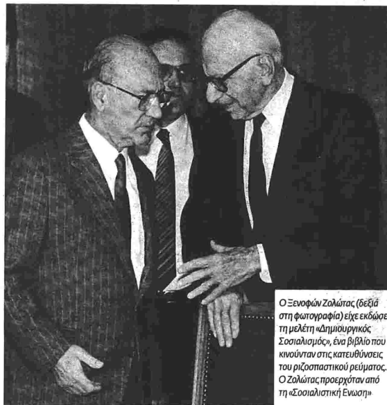
Ο Ξενοφών Ζολώτας (δεξιά στη φωτογραφία) είχε εκδώσει τη μελέτη « Δημιουργικός Σοσιαλισμός », ένα βιβλίο που κινούνταν στις κατευθύνσεις του ριζοσπαστικού ρεύματος. Ο Ζολώτας προερχόταν από τη « Σοσιαλιστική Ένωση »

Με άλλα λόγια, η ριζοσπαστική τάση είναι αυτή που υιοθέτησε μια κενισιανή προσέγγιση για τον ρόλο του κράτους και φιλοσοφικά υιοθέτησε αξίες από τον χώρο της σοσιαλδημοκρατίας, ιδιαίτερα αυτές που σχετίζονται με το ζήτημα των κοινωνικών ανισοτήτων. Με όρους πολιτικής δράσης οι ριζοσπάστες επιδίωξαν τον εκδημοκρατισμό, την παρέμβαση του κράτους στην οικονομία, την αύξηση του εθνικού εισοδήματος, την αναστήπιση της κοινωνικής δικαιοσύνης μέσω της ισότητας ευκαιριών. Εν τέλει, επεδίωξαν την υπέρβαση του Εθνικού Διχασμού και τη δημιουργία μιας νέας νο-