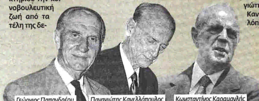
Γεώργιος Παπανδρέου, Παναγιώτης Κανελλόπουλος, Κωνσταντίνος Καραμανλής

λο, τον Γεώργιο Παπανδρέου και τον Κωνσταντίνο Καραμανλή. Είναι βέβαιο πως κάποιοι θα εγείρουν ενστάσεις για την τοποθέτηση των τριών αυτών προσώπων στο ίδιο πολιτικό ρεύμα. Δεν υπάρχει όμως καμία αμφιβολία πως πρόκειται για μια συλλήγη ιδιαίτερα γόνιμη καθώς ο συγγραφέας πετυχαίνει έτσι να αναδείξει τα κοινά στοιχεία των παραπάνω πολιτικών προσωπικοτήτων και των ρευμάτων που οι ίδιοι ηγήθηκαν. Στην ουσία θα μπορούσαμε να αποκαλέσουμε την προσέγγιση του Χατζηβασιλείου « δομική » υπό την έννοια πως ο βασικός πυρήνας της ανάλυσής του δεν επηρεάζεται τόσο από τη συγκυρία όσο από τα διαχρονικά συστατικά και τον χαρακτήρα μιας συγκεκριμένης πολιτικής τάσης.