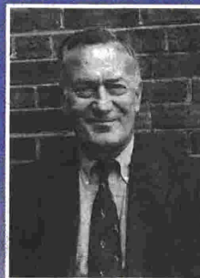
Ο πρώην διπλωμάτης και μετέπειτα πρέσβης των ΗΠΑ στην Αθήνα Ρόμπερτ Κίλι μιλάει στο βιβλίο για τα ταραγμένα χρόνια της δικτατορίας