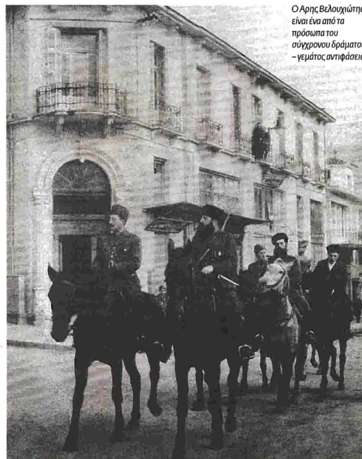
Ο Αρης Βελουχιώτης είναι ένα από τα πρόσωπα του σύγχρονου δράματος - γέματος αντιφάσεις