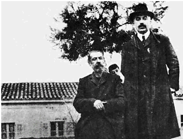
Η κλασική φωτογραφία: στην Πλατεία της Δεξαμενής, καθισμένος ο Αλέξανδρος Παπαδιαμάντης και όρθιος ο Γιάννης Βλαχογιάννης.

Ο Παπαδιαμάντης κλείνεται στο εαυτό του, κάτι που δεν οφείλεται μόνο στις οικονομικές δυσκολίες του βίου του. «Είναι μια διάσταση του βίου αυτό το κλείσιμο. Είναι μια γεννής μελαγχολία...».