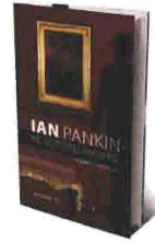
ΙΑΝ ΡΑΝΚΙΝ Με τις πόρτες ανοιχτές Μτφρ. Αλ. Κονταξάκη Εκδ. Μεταίχμιο

Κλοπή πινάκων και στις δύο περιπτώσεις από πλούσιους άντρες, υπεράνω κάθε υποψίας. Από κει και πέρα αρχίζουν οι διαφορές. Τρεις τον αριθμό οι άντρες στο μυστήριο του Ράνκιν, ένας τρα-