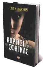
ΣΤΙΓΚ ΛΑΡΣΟΝ Το κορίτσι στη φωλιά της σφήγκας Μτφρ. Γ. Μαθόπουλος Εκδ. Ψυχογιός

Στο πρώτο βιβλίο, «Το κορίτσι με το τατουάζ», που είδαμε και στις αίθουσες, η Λίσμπετ βοηθάει τον Μίκαελ να ξεπλύνει το όνομά του σε μια ιστορία με άντρες που μισούν τις γυναίκες, πολλά χρήματα και πολλή διαπλοκή και διαφθορά. Στο δεύτερο, η Λίσμπετ και ο Μίκαελ χάνονται και συνομιλούν μό-