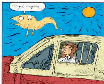
Ο Μικρός Πρίγκιπας του Τζοάν Σφαρ με τις υπερβολικά διασταλμένες γαλάζιες κόρες και το διαβολικό γέλιο, κλείνει το μάτι στους παλιούς αναγνώστες και τους καλεί να τον ξανακαλύψουν.