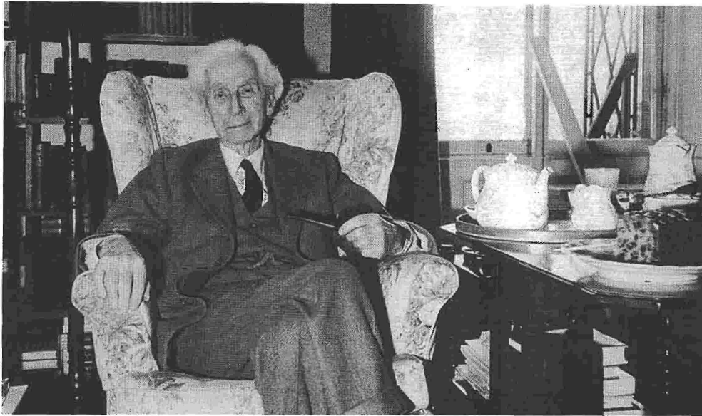
Ο Μπέρτραντ Ράσελ. «Έγραφε βιβλία για το πώς να αλλάξεις τον κόσμο κι ήταν η γνήσια προσωποποίηση του στρατευμένου διανοούμενου», λέει χαρακτηρίζοντας τον Βρετανό φιλόσοφο ο Ρέυ Μονκ.

δεν είναι πια παρά ο Βιτγκενστάιν του Λουτάρ κι όχι πραγματικός Βιτγκενστάιν. Ακόμη και στην αρχαιολογία χρησιμοποιούν τον Βιτγκενστάιν με τον δικό τους ευφάνταστο τρόπο. Για να πω την αλήθεια, όσο αυξάνεται το ενδιαφέρον για τον Βιτγκενστάιν σε πεδία εκτός φιλοσοφίας, τόσο μειώνεται στη φιλοσοφία.