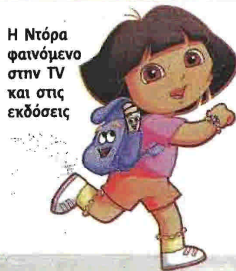
Η Ντόρα φανόμενο στην TV και στις εκδόσεις

Σωματοφύλακες (Modern Times) πούλησε 34.000 αντίτυπα και η σειρά Νεράιδες των λουλουδιών των ίδιων εκδόσεων 50.000! Περί τις 10.000 αντίτυπα πούλησε η σειρά Μαγικές Μπαλαρίνες (επίσης Modern Times).