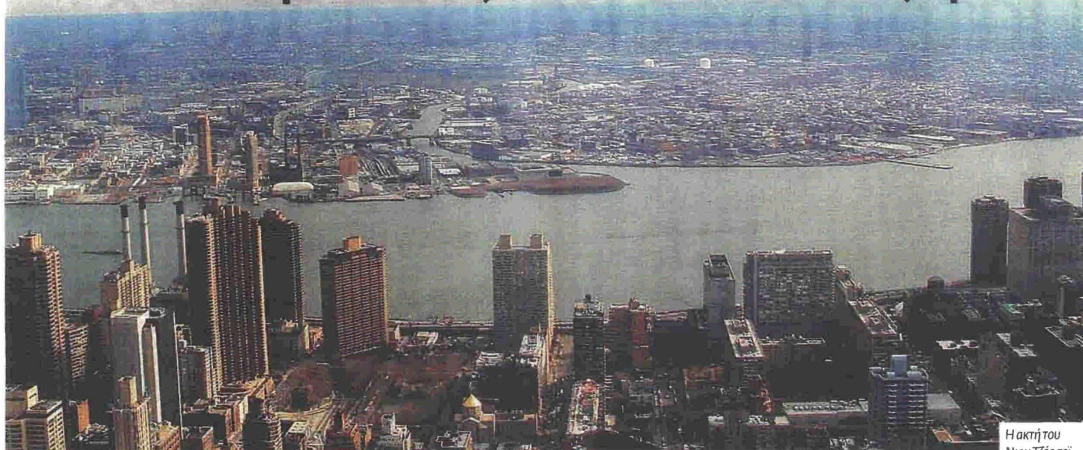
Η ακτή του Νιου Τζέρσεϊ όπως φαίνεται από το Μανχάταν