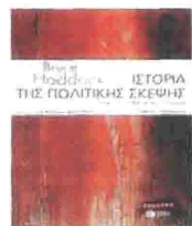
Bruce Haddock ΙΣΤΟΡΙΑ ΤΗΣ ΠΟΛΙΤΙΚΗΣ ΣΚΕΨΗΣ ΑΠΟ ΤΟ 1789 ΜΕΧΡΙ ΣΗΜΕΡΑ ΜΤΦ. ΒΑΣΙΛΗΣ ΦΡΟΣΥΝΟΣ ΕΚΔ. ΠΑΤΑΚΗΣ, 2009

Το βιβλίο του Μπρους Χάντοκ δεν αποτελεί εγχειρίδιο της πολιτικής σκέψης κάποιων σημαντικών στοχαστών και δεν θα πρέπει να κριθεί απ' αυτήν την οπτική γωνία. Η αξία του έγκειται στην προσπάθειά του συγγραφέα να αποδείξει, μέσω της ανάδειξης του προβληματισμού μεγάλων στοχαστών του νεωτερικού κόσμου, πως η δυσκολία της υποστήριξης κοινών ηθικών και πολιτικών αξιών δεν σημαίνει πως πρέπει να απορρίψουμε εντελώς τη δυνατότητα διατύπωσης καθολικών αρχών. Η κοινή λογική είναι παρούσα σ' όλες τις πολιτικές κουλτούρες και αυτό κάνει εφικτή τη διατύπωση κοινών κανονιστικών πλαισίων. Ο συγγραφέας, σε καιρούς αμφισβήτησης των καθολικών προτύπων και απολυτοποίησης της σημασίας των ιστορικών και πολιτισμικών παραγόντων, αναζητεί ακριβώς την ισορροπία ανάμεσά τους και αυτό κάνει το βιβλίο ιδιαίτερα χρήσιμο και σημαντικό.