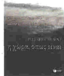
Richard Ford Η ΧΩΡΑ, ΟΠΩΣ ΕΙΝΑΙ ΜΤΦ ΣΠΥΡΟΣ ΤΣΟΥΤΚΟΣ, ΕΚΔ. ΠΑΤΑΚΗ 2009, ΣΕΛ. 735

Μέσα σε ένα τρίμηνο, Τρίτη, Τετάρτη και Ημέρα Ευχαριστιών, ο αφηγητής απλώνει την ογκωδέστατη πρωτοπρόσωπη αφήγησή του. Μέσα στη χαλαρή σύνδεση επεισοδίων που αποδίδουν την αποσπασματικότητα και τη φυγόκεντρη ορμή της ζωής, όμως καταλήγουν να συγκροτούν πλοκή, χωράνε: μια κηδεία, μια έκρηξη βόμβας, μια αυτοκτονία, μια ένοπλη επίθεση, μια κατεδάφιση, το σπάζσιμο ενός αυτοκινήτου, καβγάδες, υπόγειες εντάσεις και χαρές. Πιο αναλυτικά, τα πράγματα έχουν ως εξής: ο πενήνταπεντάχρονος Φορντ είναι μεσίτης ακινήτων. Πάσχει από καρκίνο του