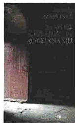
«Ο ΑΡΓΟΣ ΘΑΝΑΤΟΣ ΤΗΣ ΛΟΥΣΙΑΝΑ ΜΠ.» του Γκιγιέρμο Μαρτίνες. Μετάφραση: Ιφιγένεια Ντούνη. Εκδ. «Πατάκι», σελ. 272, € 15.50

Την είχε γνωρίσει δέκα χρόνια πριν. Όταν η Λουσιάννα Μπ. ήταν μόλις 18, ευτυχισμένη, χαρούμενη, θελκτική και δακτυλογράφος ήδη του διάσημου συγγραφέα Κλόστερ. Ο αφηγητής στο τελευταίο μυθιστόρημα του Γκιγιέρμο Μαρτίνες, συγγραφέας επίδοσης στο δεύτερο μόλις βιβλίο. Είχε σπάσει το χέρι του, ο σπουδαίος Κλόστερ ήταν σε διακοπές και ο εκδότης τους τότε του συνέστησε τη Λουσιάννα Μπ.,