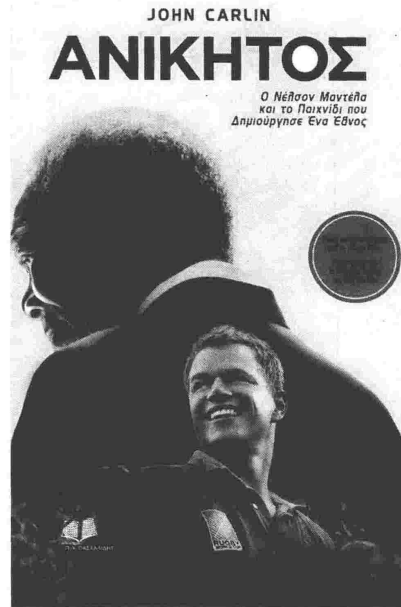
Το βιβλίο που περιγράφει πώς ο Ν. Μαντέλα κατάφερε μέσα από τον αθλητισμό να ενώσει ένα έθνος

Μέσα στη νύχτα που με σκεπάζει, μαύρη σαν πίσσα όπως είναι, ευχαριστώ όποιον Θεό υπάρχει για την ελεύθερη ψυχή μου. Υπό το βάρος των περιστάσεων ποτέ δε λύγισα, ούτε ούρλιαξα δυνατά. Όταν