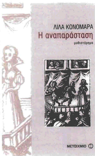
ΛΙΛΑ ΚΟΝΟΜΑΡΑ «Η αναπαράσταση» Μεταίχμιο 2009 Σελ. 296, τιμή 15,00 ευρώ

Η Λίλα Κονομάρα επιστρέφει με το... παζλ μιας ζωής