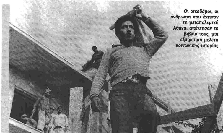
Οι οικοδόμοι, οι άνθρωποι που έχτισαν τη μεταπολεμική Αθήνα, απέκτησαν το βιβλίο τους, μια εξαιρετική μελέτη κοινωνικής ιστορίας

Το βιβλίο επικεντρώνει μια αποτίμηση των εξελίξεων στον χώρο