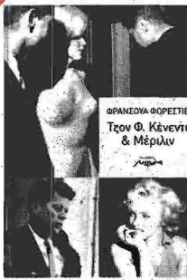
Φρανσουά Φορεστίε Τζον Φ. Κένεντι & Μέριλιν Μετάφραση: Ρίτα Κολαίτη Εκδόσεις: Μελάρι Σελ.: 312

Τις λαμπερές αλλά και σκοτεινές πλευρές της ζωής των πιο αντιπροσωπευτικών ίσως «ηρώων» της αμερικανικής κοινωνίας, του Τζον Φ. Κένεντι και της Μέριλιν Μονρόε, μας παρουσιάζει με βιογραφική ακρίβεια και μυθιστορηματική χάρη ο συγγραφέας. Πρόκειται για δυο πρόσωπα που εξέφρασαν τη λάμψη, την επιτυχία, την ευτελή, εν τέλει, και με βαρύτατο αντίκρισμα δόξα. Δυο πρόσωπα που έκρυβαν περισσότερο παρά φανέρωναν, δυο πρόσωπα που προκαλούσαν μαζική υστερία με την παρουσία τους, ο καθένας στο δικό του χώρο και επίπεδο, που εντύπωσαν περισσότερο με αυτό που δεν ήταν. Κι οι δυο τους έμειναν με ήρωες του Χόλλιγουντ, και κατά πως τα φέρνει η ζωή, που μερικές φορές ξεπερνά σε ειρωνεία τον ίδιο της τον εαυτό, το μόνο που δεν ευτύχησαν να δουν από το Χόλλιγουντ είναι το γλυκανάλατο χάπι εντ. Και οι δυο είχαν τραγικό τέλος, σκοτεινό, αφήνοντας ένα σωρό νοσηρά ερωτηματικά και μια πικρή γεύση. Το βιβλίο ξεκινά με τη δολοφονία του αμερικανικού προέδρου, την οποία περιγράφει καρέ καρέ με εξωφρενικές λεπτομέρειες, δίχως κανένα