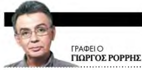
ΓΡΑΦΕΙΟ ΓΙΩΡΓΟΣ ΠΟΡΦΥΡΙΣ

Ενα μυθιστόρημα που πετσοκόπηκε με ψαλίδι και κατακερματίστηκε σε μια συλλογή 87 κειμένων