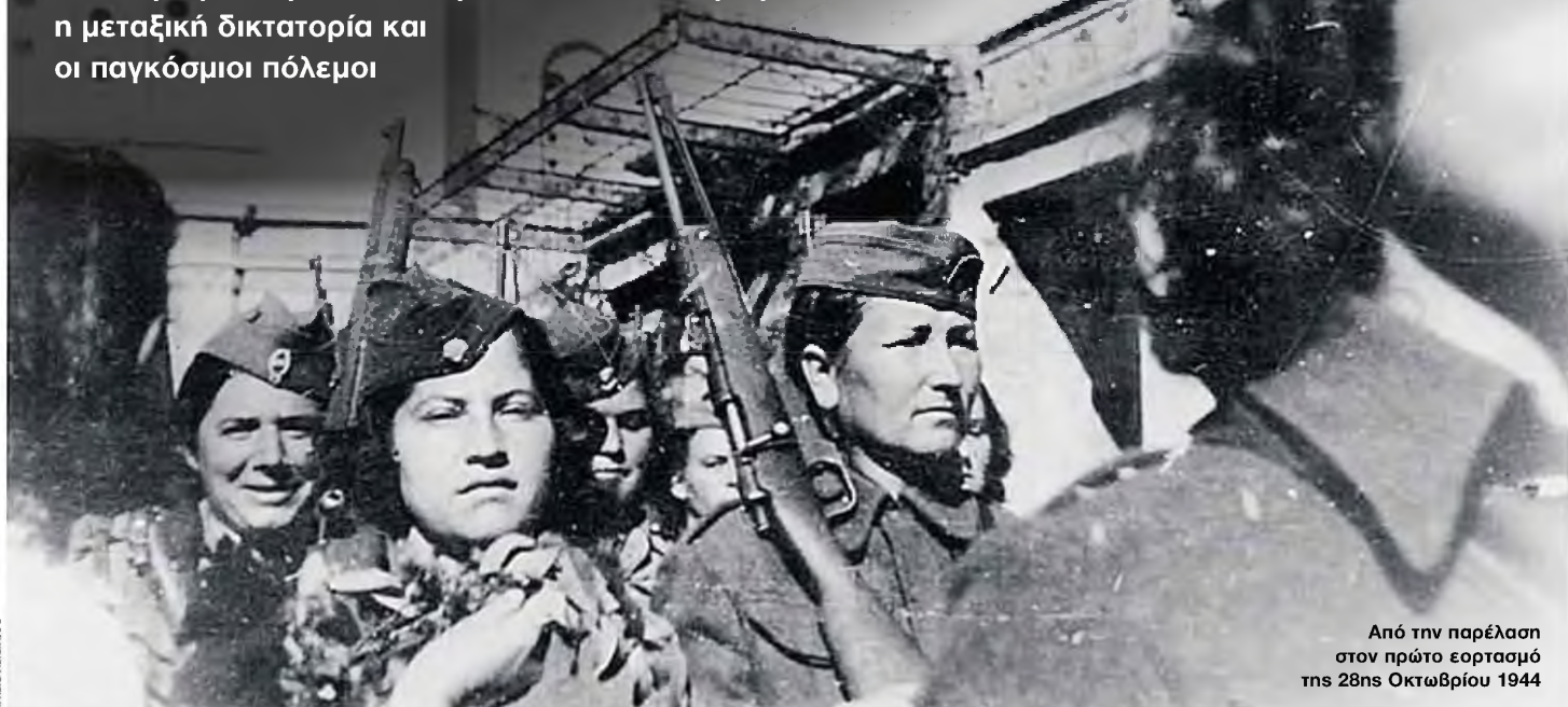
Από την παρέλαση στον πρώτο εορτασμό της 28ης Οκτωβρίου 1944

Τρία βιβλία, εκ των οποίων ένα ξενόγλωσσο, για την κρίσιμη περίοδο 1915 - 1945, όπου εκδηλώθηκαν δύο εμφύλιοι πόλεμοι και 9 πραξικοπήματα, η Μικρασιατική Καταστροφή, η μεταξική δικτατορία και οι παγκόσμιοι πόλεμοι