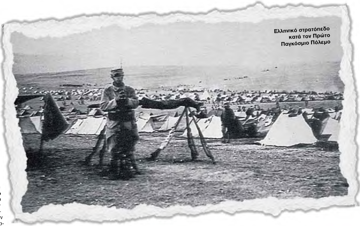
Ελληνικό στρατόπεδο κατά τον Πρώτο Παγκόσμιο Πόλεμο