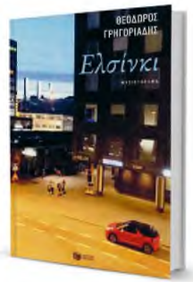
Ένα καλογραμμένο μυθιστόρημα για την αγάπη, τη διαφορετικότητα, την ανθρωπιά.

βρίσκει την πενταμελή οικογένεια του Αβίρ, του Ιρακινού πρόσφυγα, στο Ελσίνκι, όπου ετοιμάζεται να φιλοξενήσει τον Αντώνη, τον συγγραφέα και φίλο του Αβίρ από την Ελλάδα. Η σύζυγος του Αβίρ, η Εβίβ, είναι απασχολημένη με την υποδοχή του Αντώνη, τα παιδιά ανυπομονούν να δουν τον θείο ή αλλιώς μάμο Αντώνη. Χωρισμένο σε ολιγοσέλιδα κεφάλαια, το μυθιστόρημα σύντομα μας μεταφέρει χρονικά στο 2009, όταν ο Αβίρ προσπαθεί να πετύχει άσυλο στη νέα πατρίδα μέσα από έναν εικονικό γάμο, αλλά και αργότερα στην πατρίδα του, με τις αγωνίες της οικογένειάς του γι' αυτόν να διαγράφουν τις απαιτήσεις της. Έτσι αρχίζει ένα παιχνίδι με τον χρόνο, καθώς η αφήγησή του θα εναλλάσσεται χρονικά και θα περνά από το 2011 στο 2019, για να φτάσουμε στο 2023, όπου