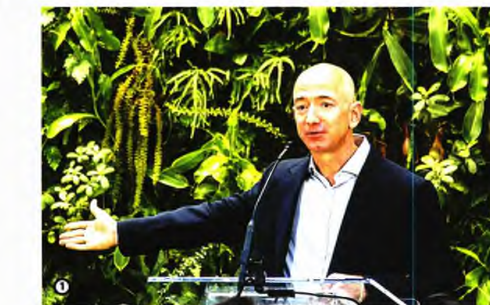
● 1, 2. Ο Τζεφ Μπέζος αλλά και ο Ελον Μασκ έχουν στρατευθεί στον αγώνα κατά της κλιματικής αλλαγής. 3. Η ταϊνία του Στίβεν Σπίλμπεργκ «Τα σαγόνια του καρχαρία» του 1975 δημιούργησε μία ολόκληρη κατηγορία φιλμ που συντηρούν την εικόνα του καρχαρία-δολοφόρου.

Η προστασία του λευκού καρχαρία έχει κινητοποιήσει πολλές περιβαλλοντικές οργανώσεις παγκοσμίως. Στον Ελλαδικό χώρο ιδιαίτερα ενισχυμένοι είναι ο επιχειρηματίας Στέλιος Χατζηγιάννης, αλλά και η περιβαλλοντική οργάνωση All For Blue με ιδρύτρια την Κατερίνα Τοπούζογλου. Την ίδια στιγμή, το Ίδρυμα του Πρίγκιπα Αλβέρτου Β' του Μονακό, το οποίο συστάθηκε το 2006 με αποστολή την