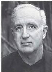
Ο Στίβεν Πρέσφιλνι.

Το μάθημα στο οποίο αναφέρεται ο Πρέσφιλνι δεν είναι άλλο φυσικά από τον πόλεμο του Βιετνάμ, τον οποίο αναφέρει αρκετές φορές στην κοινή μας. Εκείνη την εποχή είχε καταγίνει και αυτός στο στρατιωτικό σώμα των πεζονατών, αλλά χωρίς να πολεμήσει στην πρώτη γραμμή του μετώπου. Σήμερα, ακόμα κι οι φωτογραφίες με τα ελικόπτερα στην εκκένωση της Καμπούλ και της Σαϊγκόν το 1975 έκαναν πολλούς να θυμηθούν τα δύο περιστατικά και τους δύο μακροχρόνιους πολέμους από τους οποίους οι ΗΠΑ αποχώρησαν νηπιμένες. Το κοινό στοιχείο που συνδέει σε στρατιωτικό επίπεδο τις δύο περιπτώσεις, λέει, είναι ο άτακτος τρόπος πολέμου, ο γνωστός ανταρτοπόλεμος. «Στο Βιετνάμ, για παράδειγμα, είκες μια τοπική στρατιωτική δύναμη με χαρακτηριστικά φυλής, που ήταν σε περιβάλλον που γνώριζε καλά, υπερασπιζόταν τους ανθρώπους της και τον τρόπο ζωής τους, τα ιερά μέρη τους και επίσης και στις δύο περιπτώσεις υπήρχαν πολεμιστές έτοιμοι να χάσουν τα πάντα, να θυσιάσουν», σημειώνει.