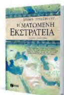
«Η ματωμένη εκστρατεία» και όλα τα βιβλία του Στίβεν Πρέσφιλνι κυκλοφορούν από τις εκδόσεις Πατάκι.