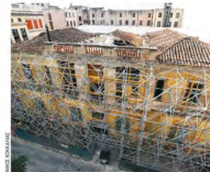
Η πρώην κατοικία του Αυστριακού πρέσβη Αντον Πρόγκες φον Οστεν και μετέπειτα Ελληνικό Ωδείο, στην οδό Φειδίου 3, αποκαθίσταται από το ΥΠΠΟΑ.