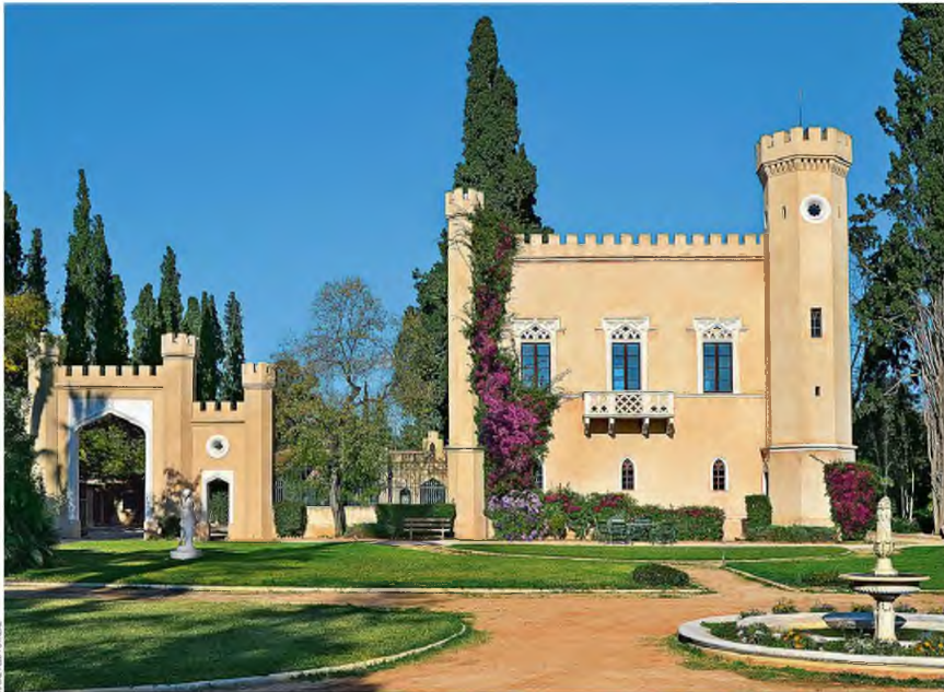
Ο Πύργος Βασιλείσσης στο Ιλιον είναι έργο της βασίλισσας Αμαλίας. Εγκαινιάστηκε το 1854 και είναι επισκέψιμος.