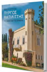
Η έρευνα γι' αυτό το νεογοτθικό κομψοτέχνημα έγινε ιστορικό λεύκιμμα.

Το αναφέρει και η Καρολίνα Μέρμηνγκα στο νέο βιβλίο της «Ο κήπος της Αμαλίας» (εκδ. Πατάκη), μια εξαιρετικά μελετημένη ψυχική ανατομία της Βασιλίσσας και του περιγύρω της, σε μια εποχή που η Αθήνα γινόταν «πόλη». Ο Χανς Κρίστιαν Αντερσεν, όταν (εκστατικός) είχε επισκεφθεί την Αθήνα (1841), πηγαίνει συχνά «και στο σπίτι του Αυστριακού πρέσβη Πρόγκες φον Οστεν, που τον περιποιείται πολύ (...) ο Αυστριακός γραμματέας, οι αδελφοί Χάνσεν και όλοι οι άλλοι της συντροφιάς διασκεδάζουν πολύ, ο Αντερσεν όμως δεν διασκεδάζει απίως. Μαγεύε-