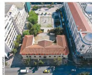
Το Εθνικό Τυπογραφείο στην οδό Σταδίου έχει παραχωρηθεί στον Δήμο Αθηναίων για πολιτιστικές χρήσεις.