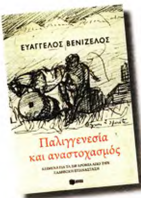
Μόλις κυκλοφόρησε το νέο βιβλίο του Ευάγγελου Βενιζέλου, με κείμενα για τα 200 χρόνια της Ελληνικής Επανάστασης

Οι επόμενες βουλευτικές εκλογές θα διεξαχθούν με το εκλογικό σύστημα της απλής αναλογικής. Πράγματι ο σχηματισμός κυβέρνησης συνεργασίας χωρίς τη συμμετοχή του πρώτου κόμματος είναι μαθηματικά και υποθετικά εφικτός, αλλά πολιτικά και πρακτικά αδύνατος. Σίγουρα αδύναμος. Ακόμη και αν γινόταν θα είχε εύθραυστη και οριακή νομιμοποίηση. Η άμεση διάλυση της Βουλής και η προκήρυξη νέων εκλογών, που θα διεξαχθούν με το ψηφισμένο σύστημα της ενισχυμένης αναλογικής, προϋποθέτουν συνταγματικά την εφαρμογή του άρθρου 37. Θα δοθούν τρεις διερευνητικές εντολές, θα γίνουν οι γνωστές επαφές, διαβουλεύσεις