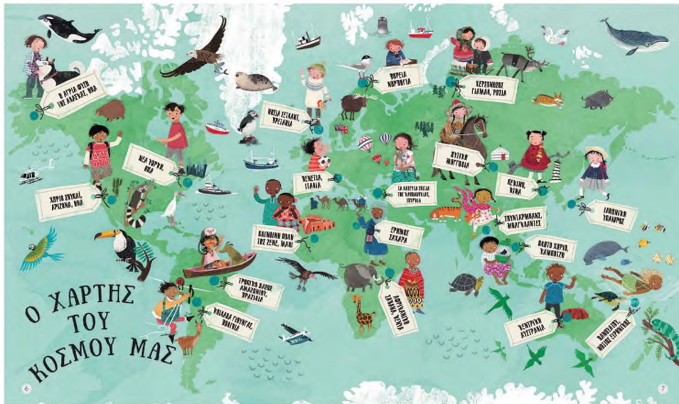
Στο ευρηματικό «Αυτός είναι ο κόσμος μας» της Τρέισε Τέρνερ παρουσιάζονται εικονίς μαθητρίσες και μαθητὸς ἀπὸ ὅλο το πλανήτη, στὸ περιβάλλον ὅπου ζοῦν καὶ μορφωνοῦνται.